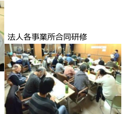
法人各事業所合同研修