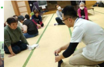
あいあい研修(マッサージ)