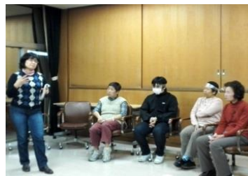
ガイドヘルパー講習