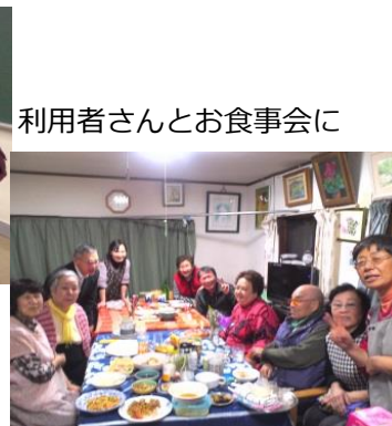
利用者さんとお食事会に