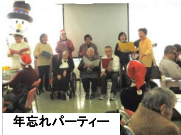
年忘れパーティー